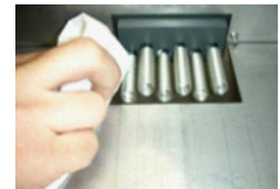
Helppo valvoa ja puhdistaa