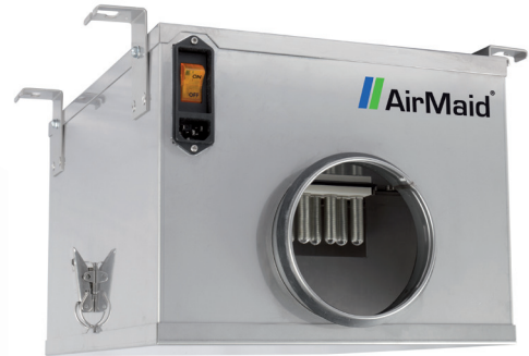
Malli AirMaid® V