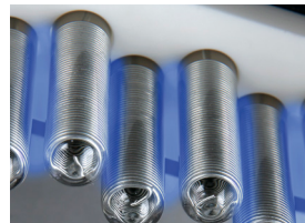
CGC "Corona Glass Cell"

CGC-teknologia on ollut markkinoilla vuodesta 1996.